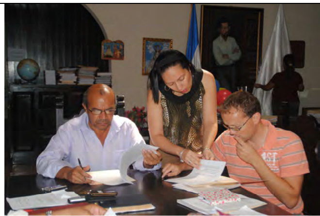
Burgemeester tekent overeenkomst

Tenslotte gaat de gemeente Leon ook verder met het stimuleren van de sociale ontwikkeling van Leon Zuidoost. Zij doet dit onder andere door het inzetten van een leefbaarheidsbudget. Dit fonds is in 2009 opgestart met technische en financiële ondersteuning door de gemeente Utrecht. Door de goeie ervaringen hiermee heeft de gemeente Leon besloten, met eigen middelen, leefbaarheidsbudgetten ook in te zetten in 2 andere wijken in Leon.