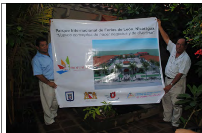
PROFOM heeft mooie plannen