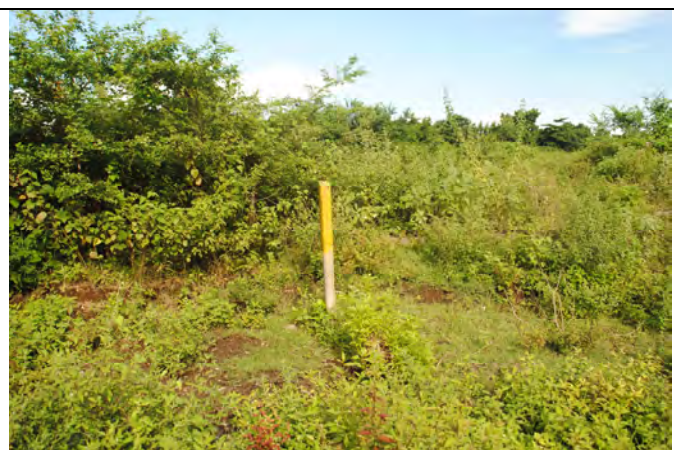
Links komt het busstation rechts de beurs