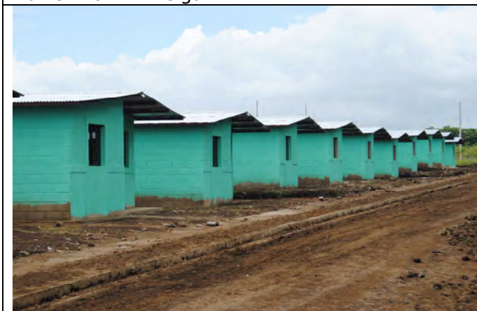
Huizen van projectontwikkelaar