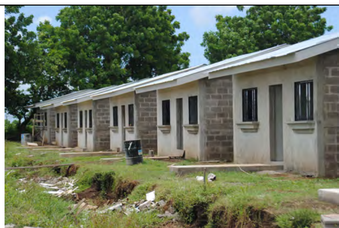
Huizen van de bouwmaterialenbank