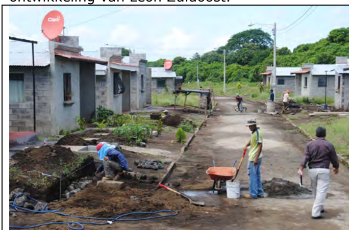
Huizen van 'El Belga'

Ook is Ceprodel, een microkredietorganisatie uit Nicaragua, dit jaar begonnen met het uitzetten de lening van 1 miljoen dollar, die met garantie van de Utrechtse woningcorporaties ondersteund wordt. Ceprodel had aanvankelijk veel moeite om de leningen in Leon uit te zetten. In eerste instantie was het de bedoeling dat zij 100 nieuwbouwwoningen zou realiseren in Leon Zuidoost, alleen bleek de hoge rente van 13% een groot obstakel. Inmiddels focust Ceprodel zich op woningbouwverbetering en het uitbreiden van woningen, zodat zij geschikt worden als woonwerkunits. Daar is vraag naar in Leon Zuidoost en het draagt ook bij aan de economische ontwikkeling van Leon Zuidoost.